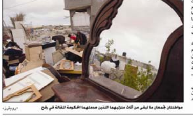
مواطنون معانين ما تشير من كاث منبرهاهه الثمانين معتمدا الحكومة للتلقة في رفح

وقال مسؤول منظمة أحياء القدس في القدس المحتلة إن حملة المقاطعة التي تنطلق من منازل الشهداء والأسرى في قطاع غزة، والتي تشمل مقاطعة منتجات المستوطنات، هي خطوة هامة في مواجهة الاحتلال الإسرائيلي. وأضاف أن الحملة تهدف إلى الضغط على الحكومة الإسرائيلية لتسحب منتجات المستوطنات من السوق.