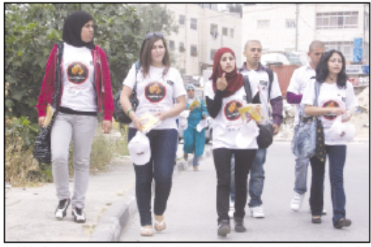
مشاركة أطفال متخول وعالية وصحية وحماس في انطلاقة حملة من بيت لبيت لقطاعة منتجات المستوطنات

تعدية اعتقال مخل ومعيد إلى لقد بتهدئة... [تفاصيل 11]