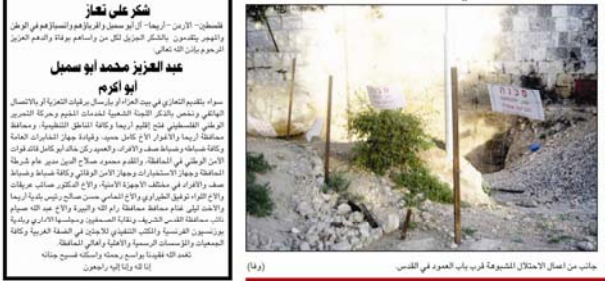
جانب من العمل الاحتلال المشبوه قرب باب العمود في القدس