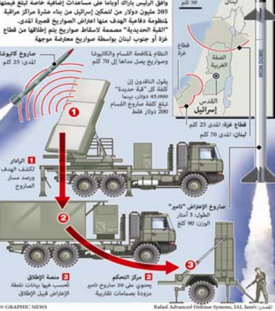
يسمى درع الصواريخ بوضع طريقة استخدامه بكثافة