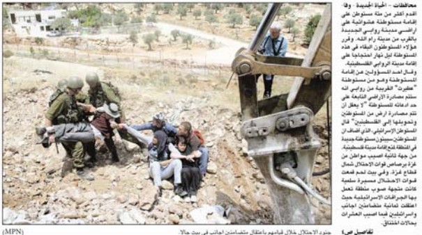
مخاضات الجدة الجديدة - وفا: اذات الرئاسه اسبوعيا، ابرق مسلحون مجهولون يضرمون نارهم لوقاه القوات...