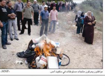
مواطنون يجمعون من منتجات مستوطنات في فلسطين أمس.