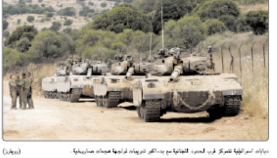
بيلاد اسرائيل تتحرك قرب الحدود الفلسطينية من بعد انقراض عملية تبادل اسرايين (مخبر)

القدس - وفاد: تقنيا هو: الفلسطينيين لم يقدموا أي عرض لتبادل الأراضي، وذلك في إطار عملية استيطانية جديدة.