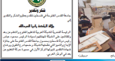
مواطنين يشعرون ما عجزت من مزيجها الفئران هدمتها حماس في رفح