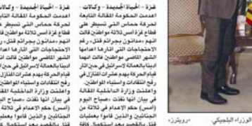
الرئيس ناثا استقبله نائب رئيس الوزراء البلجيكي، روبرتس