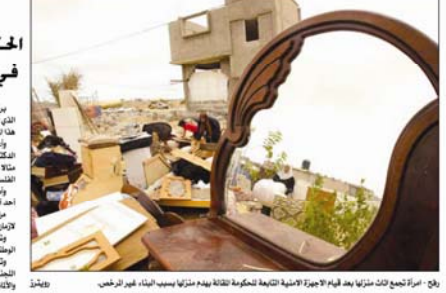
رفح - أرادت تجمعات ثلثا مائة بعد انهيار الأعمدة الخرسانية للقناة بعد مذبحة سبب المثلث، الغير المرخص، برفح