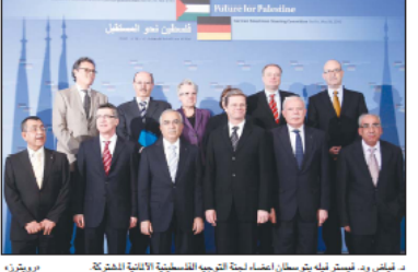
مفاوضون وفلسطينيون يوقعون على إعلان قيام الدولة الفلسطينية