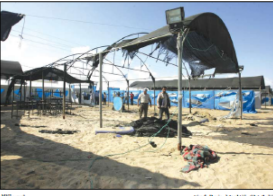
قرا في غزّة، حيث غرقوا في مياه البحر...