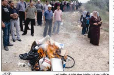
مواطنون يجرؤون من منتجات مستوطنات في سبلتيت السمس