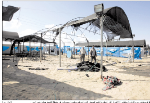
فلسطينيون من الأونروا يعترضون المصارع الإسرائيلي الذي نفذت فيه عملية قصف مخيمين صيفيين في منطقة الشيخ حجاج، فجر أمس.

كثف قاذف أبو عيون: أقدم مسلحون يهوديون في فلسطين، أمس، إطلاق النار في أكبر مخيمات الأونروا، الصيفية، الذي يضم تسعة سفار الفلسطينيين، في مخيم الصيفية، مخيمين على خط التماس بين غزة وإسرائيل، وذلك في عملية تستهدف أكثر من ١٠٠ فلسطيني.