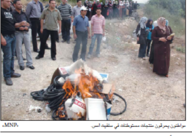
مواطنون يرمقون منتجات مستوطنات في سلويات الأسر