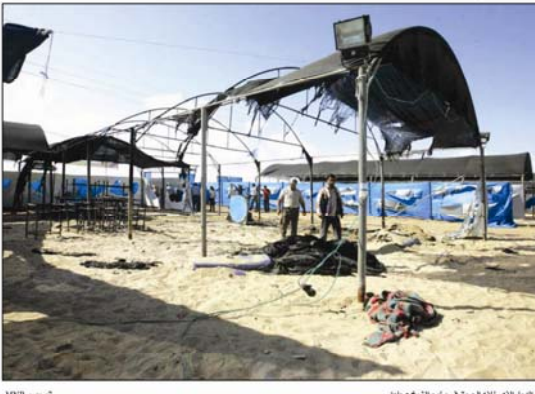
غزة - المزارعون يحرقون خيمهم الصيفي في بلدة بيت حنات.