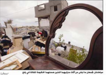
مواطنان يجمعان ما تبقى من أحد منازلهم المدمرة الحكومية للقطاع في رفح.

وقال منسق الحملة جيمس الغلالي المأخوذ من بيت جيب في قطاع غزة، إن الحملة التي تنطلق من منازل الشهداء والأسرى، تهدف إلى مقاطعة منتجات المستوطنات الإسرائيلية، وإسقاطها من الأسواق المحلية. وأضاف أن الحملة تهدف إلى إضفاء الطابع الإنساني عن المستوطنات، وإظهارها كمنتجات تجارية عادية، وليس كمنتجات عسكرية. وقال إن الحملة ستستمر حتى يتم إسقاط المستوطنات من قطاع غزة.