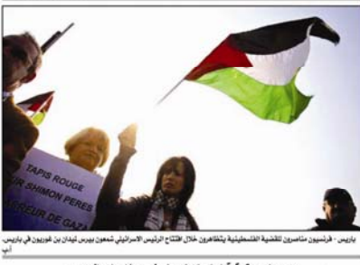
باريس - فريديريك ماسوني التقطت هذه الصورة خلال تظاهرة الفلسطينيين في باريس من أجل دعم حركة التحرير الفلسطينية.