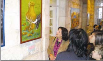
معرض الفنون المقدسيات، القدس - التقطت هذه الصورة خلال افتتاح المعرض.