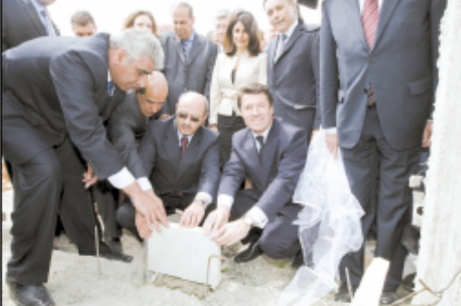
الاحتفال بوضع حجر الأساس لمنطقة بيت لحم للصناعات إبوابه : تؤكد للرئيس عباس وساركوزي بأننا سنحقق أملمها بتعزيز الصمود لأهلنا في فلسطين

الجمعة ١٩/٠٤/٢٠١٩ - ١٩ ربيع الثاني ١٤٤١ هـ - العدد: ١٩٧٦ - الصفحة: ١٠٧٩ ذروة : الأيوبي يرد به داخل بغداد ٢٥ الأيوبي وإذنته تدخل مابها الخالدون ربيته الجمعة الوطنية في باكستان توافق على إصلاح يحرم الزنوج من صلاحيته الصودانيون يشكرون الأجداد انتخابات تعديلية خلال ربيع ثلث زلزال وهول معاديات القنابل قد يقضي على مفاهيم مبالغة