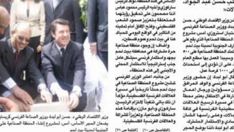
المناس في هذه المنطقة، تؤكد الرئيس استروزي وأولادة الرئيس مدفديف عن إنشاء منطقة صناعية في بيت لحم. ويعلنان عن إنشاء المنطقة الصناعية في بيت لحم.