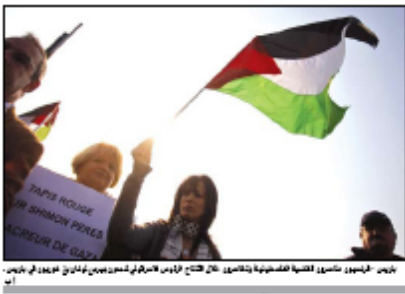
جريس : تجسد انتموية فلسطينية التماثل في كل من فلسطين وشرق القدس المحتلة