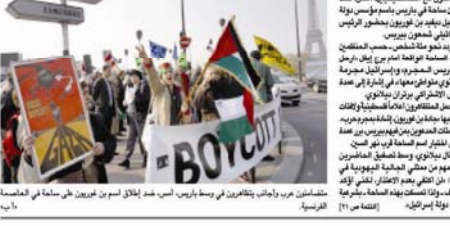
مظاهرات قرب رابطة بتقارير بن وبدا رسم أسير أسير بن غوريون على ساحة في العاصمة الفرنسية