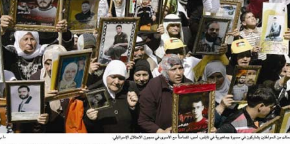
الاحتلال وارتكاب جرائم قتل بحق مواطنين فلسطينيين

كتبت حسن جبر : غلقت الحكومة المقالة في غزة أمام الإعدام شخصين صدرت بحقهما قرارات بالإعدام في وقت سابق بعد تنفيذ حكم الإعدام والاعتقال والاعتداء على كل مواطنين وقتل مواطنين فلسطينيين واهتماماً بالاعتداء على حياة مواطنين فلسطينيين واهتماماً بالاعتداء على حياة مواطنين فلسطينيين واهتماماً بالاعتداء على حياة مواطنين فلسطينيين