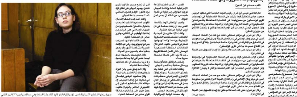
قيل ان تسعة معلومات إسرائيلية تم سرقتها من الجيش الإسرائيلي، مما أسفر عن مقتل عدد من عناصر الجيش الإسرائيلي.

سيرة زهنا السطاط الإسرائيلية، أمس لإسرائيلية (إم إم)، مجلة إنستات في مسقطها يوم ١٦ كانون الثاني ٢٠١٠هـ.