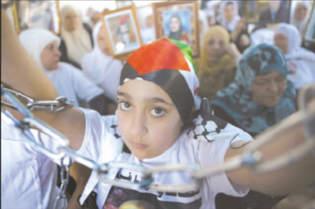
تلا تجلس في الصف في مدرسة للبنات في بلدة بيت لحم في الضفة الغربية.

تقديم قصود المواطنين في منطقة الاغوار اعادة معالم بناها الدولة