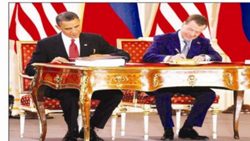
باراك أوباما والرئيس الروسي ديمتري ميدفيدف يوقعان معاهدة جديدة لخفض الاسلحة النووية في "جراغ" بروسيا.

برغ - ( د ب أ ) - وقع الرئيس الأمريكي باراك أوباما والرئيس الروسي ديمتري ميدفيدف في "جراغ" بروسيا معاهدة جديدة لخفض الاسلحة النووية، وشهدتا على أن معاهدة جديدة لخفض الاسلحة النووية، وشهدتا على أن معاهدة جديدة لخفض الاسلحة النووية، وشهدتا على أن معاهدة جديدة لخفض الاسلحة النووية.