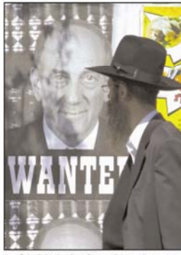
يهودي من سكان في القدس ينظر الى صورة الامارت كريت عليها (مطبوع) (أ.ب.ع.ب)