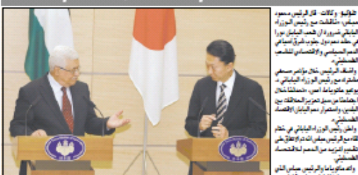
الرئيس محمود عباس ورئيس الوزراء الياباني شينزو آبي خلال مؤتمر صحفي مشترك.

اليابان تشهد المزيد من الدعم الاقتصادي الفلسطيني وان تسترد الباقى الذي اغتصبه اسرائيل في حدود 70 والنس