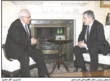
الرئيس عباس خلال لقاءه مع انغلا بركه...