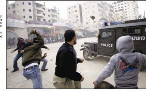
القدس - شوان يابسون بالحجارة لاعتقال خلال مواجهات واعتقالات جرد في مخيم شعفاط بالأحياء الشمالية الغربية.

القدس - وقالت القصة فقتحت فغيره من الشرطة الاسرائيلية غير اسير مخيم شعفاط والاحياء الشمالية الغربية واسباحية السلام وراس شمخان من عشرين من دفع الضربات وبعدهم في مساحات احياء القدس العربية. ويعتقد على ابناء وبنات احياء القدس الاسرائيلي. [لمتحة ص١٩]