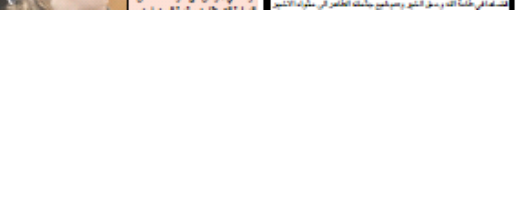
مؤتمر صحفي في بيت ساحور بعد اعلان جرح الاحتلال عزله من الضفة التي تعزل الطوابق.