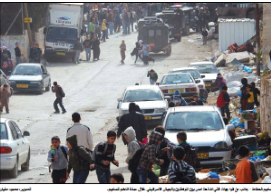
تصوير مصورين محليين يوثقون تكتيل الفلسطينيين في مدينة شعفاط.