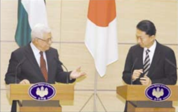
الرئيس محمود عباس ورئيس الوزراء الياباني ناوتو كان خلال مؤتمر صحفي مشترك في القدس (أ. ف. ب.)

اليابان تقدم المزيد من الدعم لاقتصاد الفلسطيني وتعارف بالواقع الذي تفرضه اسرائيل في حدود 77 والقدس