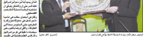
الرئيس الفلسطيني محمود عباس يتسلم شهادة تقدير من الرئيس الإسرائيلي شيمون بيريز.