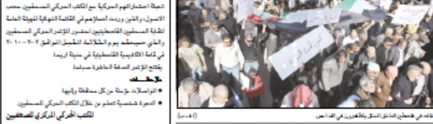
الناشطون في هدم البيوت العربية يتظاهرون في اللد...