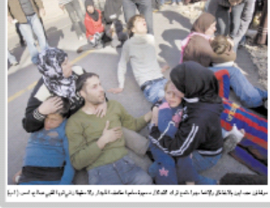
مظاهرات في الضفة الغربية، ٢٠ كانون الأول/ديسمبر ٢٠١٠

إسرائيل تلغي اتهامات تقريظ غولديستون وتعتزم تشكيل لجنة تحقيق محدودة الصلاحيات في مؤتمر، الثلاثاء، كان هناك جمع كبير من المصلحين الدينيين من دولتين، إسرائيل وفلسطين، حيث ناقشوا قضية الحجاب في المدارس. وقالوا إنهم يريدون تغيير القوانين التي تمنع الحجاب في المدارس، لأنهم يعتبرون الحجاب جزءاً من دينهم.