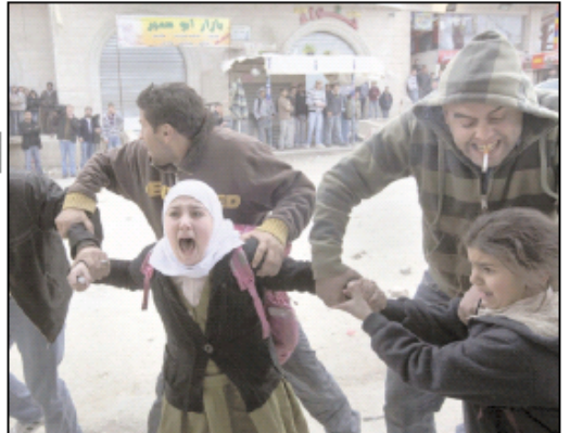
مظاهرات في بيت ساحور بعد اعلان جرح الاحتلال عزله من الضفة التي تعزل الطوابق.

تحت رحمت بالخطوة وحماست أعلنت معارضتها القوية الحكومة تحدد 17 تموز المقبل موعدا للبدء بانتخابات المجالس والهيئات المحلية