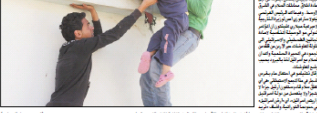
عاشق فلسطيني يمد يده لمساعدة طفلة...