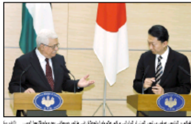
الوزير الإسرائيلي يورئيل كاتون يشرح لوزير الخارجية الأميركي جون كيري...