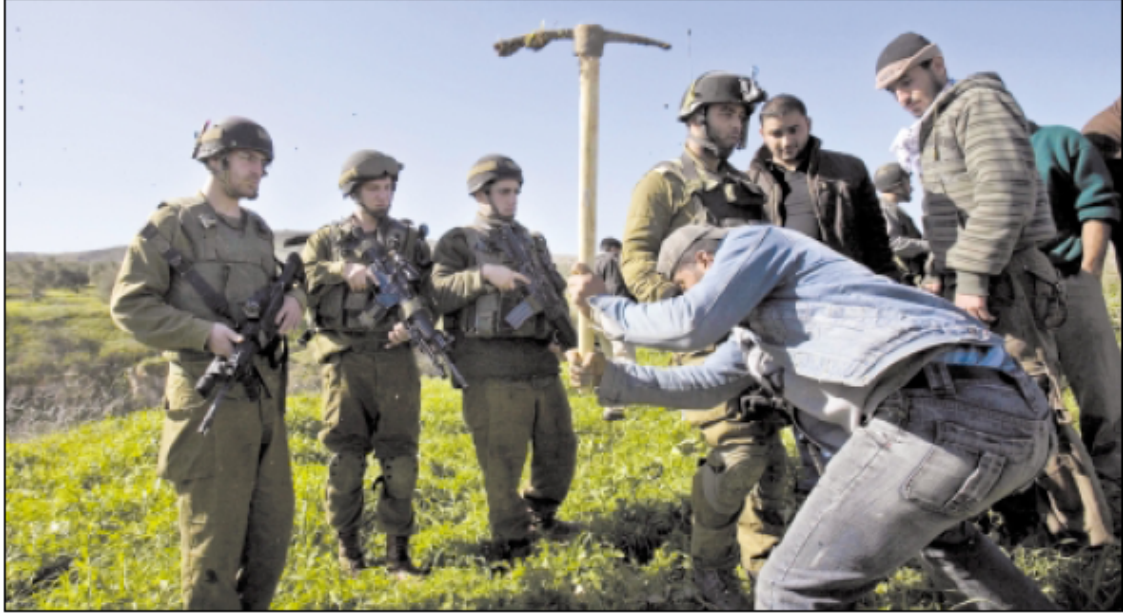
(أب) شاب يغرس شجرة في اراضي يورين المهددة بالصادرة رغم اعتداء جنود الاحتلال على المشاركين في الفعالية.

لكنه اهتمام لا يرقى إلى اهتمام صحيفة "القدس" به، والتي جعلته عنواناً رئيسياً لها، وإن كانت اختصت به منفرداً كما فعلت "القدس" دون أن تدمجه بأخبار وتقارير أخرى كما فعلت "الحياة الجديدة"، لكن عنوان "الأيام" جاء باهتاً، ولا يتناسب مع أهمية هذا الحدث المحلي ودلالاته السياسية، وهي أهمية مرتبطة بما تتعرض له الأرض الفلسطينية من نهب للأراضي، وقطع للأشجار لصالح المشروع الاستيطاني اليهودي. وبالتالي كانت تغطية "القدس" لهذا الحدث هي الأفضل، سواء من حيث موقع الخبر وما حمله من عناوين خطت باللون الأحمر وبالبنط العريض للدلالة على أهمية الحدث.